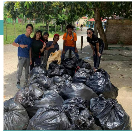
La fondation a offert à la communauté un container dont elle n’a pas l’utilité depuis que nous ne pouvons plus assumer les frais des goûters.