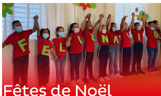
Fêtes de Noël