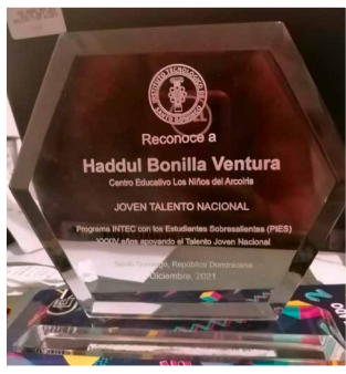
Haddul. Promo D1 Prix Universitaire d'excellence «Jeune Talent National»